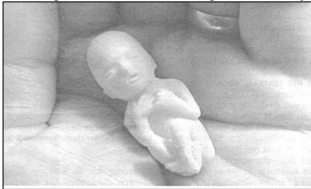
Als de 'wensouders' medisch ongeschikt zijn om een kind te krijgen, is zo'n weigering meestal goed uit te leggen.

er een protocol moet komen, een kader waarbinnen artsen hun beslissing over een IVF-behandeling kunnen nemen. Het moet duidelijk zijn waarom een arts een behandeling weigert en ook wat daar voor procedure aan vooraf is ge-