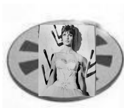
Hij zag zijn aanstaande voor de schijf staan...