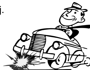
De kar kreeg een lekke band

Hiermede eindigt het verhaal van onze held 20 . Een blues voor Jantje zongen de vogels in het veld. "Jezus", zei de dominee, "sta zijn zieltje 22 bij 21 ." Maar Jantje had er maling aan 23 , want Jantje was vrij. Jantje was vrij. Jantje was vrij.