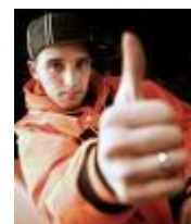
een positieve mentaliteit