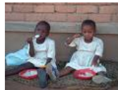
eten voor een Afrikaans kind is te duur...