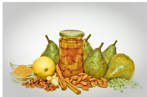
Het recept en de ingrediënten van Kugel met peren