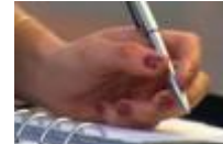
ik schrijf mijn gevoel op een stukje papier...

Maar dit kan niet meer, ik sta op en demonstreer 15 , protesteer tegen degene die probeert onrust te zaaien 16 waaronder de media 17 die mijn woorden verdraaien omwille van sensatie 18 . Iedereen is gelijk, fuck discriminatie. De wereld bevindt zich nu in een kutsituatie.