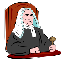
de rechter zegt: je bent een jeugddelinquent!

De rechter zei: "Hé Jantje, weet jij wel wat je bent? Dat noemen wij juridisch 6 jeugddelinquent 7 . Een schande voor je ouders, je toekomst naar de maan 8 , want als je later groot bent, krijg je nooit een goede baan."