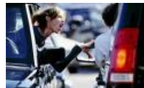
agressie in het verkeer...