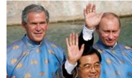
wereldleiders verklaarden oorlogen...