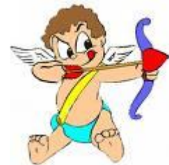
Amor mist nooit met zijn pijlen...

Maar na jaren werd het haar te machtig 10 en vertelde zij het hem maar. Iwan vond het eigenlijk wel prachtig en werd snel verliefd op haar. Maar toen hij dus zijn aanstaande 11 voor de schijf zag staan keek hij haar opeens met hele andere ogen aan, werd nerveus 12 , hij trilde 13 , miste, raakte en ze zakte in elkaar 14 , en met een laatste blik 15 op hem zong zij met reeds gebroken stem: