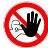
barricades in menselijke vorm...