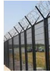
hindernissen blokkeren mijn wegen...