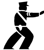
Hij werd geschaduwd door een brigadier

Maar hij werd geschaduwd 3 door een brigadier 4 . Die zei tegen Jantje: "Hé, kom jij maar eens hier. Ik weet niet of je het weet, maar rijksdaalders op straat zijn verloren goederen 5 en horen aan de staat."