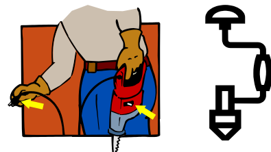
Pa stuurde hem een boor

Buiten de bajes zag hij een auto staan. "Die leen ik maar", zei Jantje, zo gezegd, zo gedaan. Maar in een scherpe bocht kreeg die kar 18 een lekke band, sloeg zeven maal over de kop 19 en vloog in de brand.