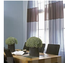
ik zie het licht door de gordijnen...

Ik doe de lichten uit en de kamer wordt nu donker, een straatlantaarn 7 buiten geeft wat licht. En de dingen in de kamer worden vrienden die gaan slapen de stoelen staan te wachten op 't ontbijt. En morgen word ik wakker met de geur 8 van brood en honing, de glans 9 van 't gouden zonlicht in jouw haar. En de dingen in de kamer, ik zeg ze welterusten 10 , vanavond gaan we slapen en morgen zien we wel. Maar de dingen in de kamer zouden levenloze 11 dingen zijn zonder jou.