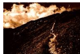
Als het spoor verdwijnt in de avond...

Wat moet je doen als de nacht gaat spoken Met wat je onderweg verloor Als de mooie woorden zijn vervlogen 11 ? Vergeet en ga maar weer door