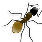
De mensen als mieren zien gaan...

Ik heb het kronkelpad 8 gelopen Door het gruis 9 en door het gras Als het spoor 10 verdwijnt in de avond Dan wordt het stil en voel je het pas