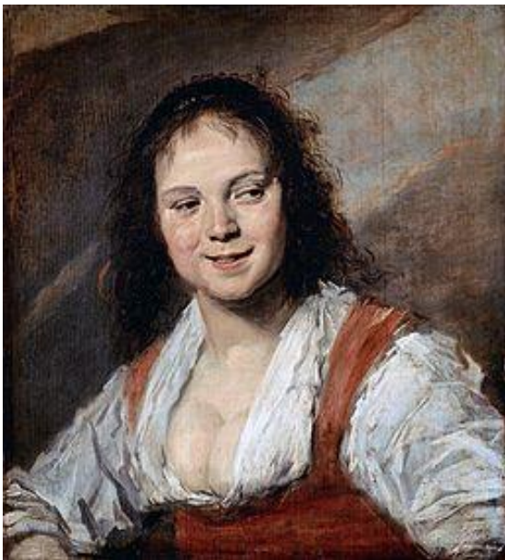
'Zigeunermeisje' van Frans Hals