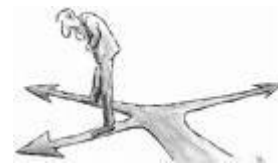
ze wijzen de paadjes waarlangs je mag gaan...

De mensen, ze schrijven je leefregels voor 11 ze geven je raad 12 en ze roepen in koor 13 : "Zo moet je leven".