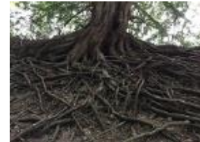
Losgescheurd van mijn wortels...

Ik heb mijn kleine stad verlaten Me van mijn wortels 2 losgescheurd 3 En nu, al die jaren later Vraag ik me af wat er is gebeurd