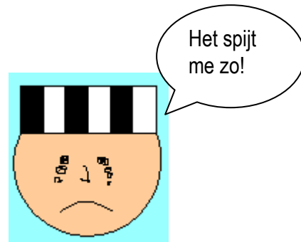
Hij heeft tranen in zijn ogen en toont berouw...