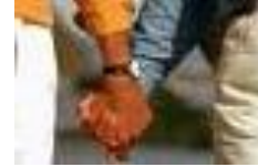
hand in hand...

Nu hoef je nooit je jas meer aan te trekken en te hopen dat je licht het doet. Laat buiten de stormwind nu maar razen 1 in het donker want binnen is het warm en licht en goed. Hand in hand naar buiten kijken waar de regen valt, ik zie het vuur van hoop en twijfel 2 in je ogen en ik ken je diepste angst 3 .