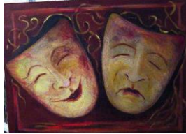
wat moet je met die Januskop?

Zoek jezelf broeders, vind jezelf, wees en blijf alleen jezelf