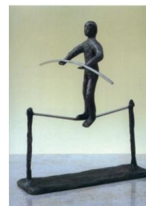
Dat houdt de zaak in evenwicht.

Ik zal m'n vrienden niet vergeten, want wie me lief is blijft me lief, en waar ze wonen moest ik weten maar ik verloor hun laatste brief. Ik zal ze heus 8 nog wel ontmoeten 9 , misschien vandaag, misschien over 'n jaar. Ik zal ze kussen en begroeten het komt vanzelf weer voor elkaar 10 .