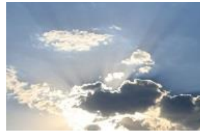
Schepen op een glanzende zee...

Ik was een kind dat keek naar de wolken Schepen op een glanzende 1 zee Hoog door het vuur van de hemel En ik wist: eens ga ik mee