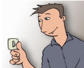
die knop moet enkel even om!

Zoek jezelf zusters, vind jezelf, wees en blijf alleen jezelf