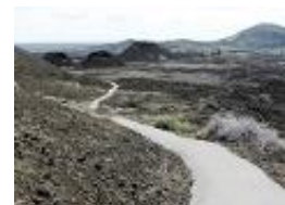
het kronkelpad door het gruis...

Gestreeld en gekrast door de liefde Gestreeld en gekrast door de tijd Gestreeld en gekrast door het leven Dat speelt met je dromen Gestreeld en gekrast