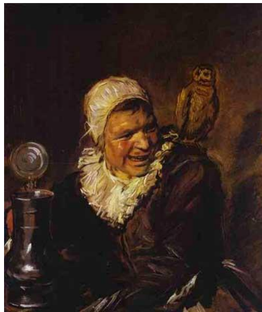
'Malle Babbe' van Frans Hals