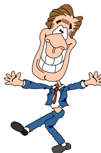
hij lacht, en danst wat in het rond

Ze wil hem slaan, maar hij kan nog net bukken 2 Ze slaat mis, ze dondert 3 op de grond Ze zegt: "Hé, jij moet gek zijn!" Hij lacht, en danst wat in het rond. Hij zegt: