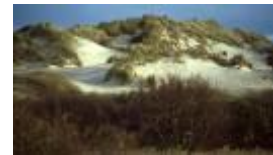
We gaan lopen door de duinen...

En als je 's morgens opstaat ben ik bij je en misschien heb ik al thee gezet. En als de zon schijnt buiten gaan we lopen door de duinen 5 , en als het regent gaan we terug in bed. Uren langzaam wakker worden, zwevend 6 door de tijd, ik zie het licht door de gordijnen en ik weet: het verleden geeft geen zekerheid