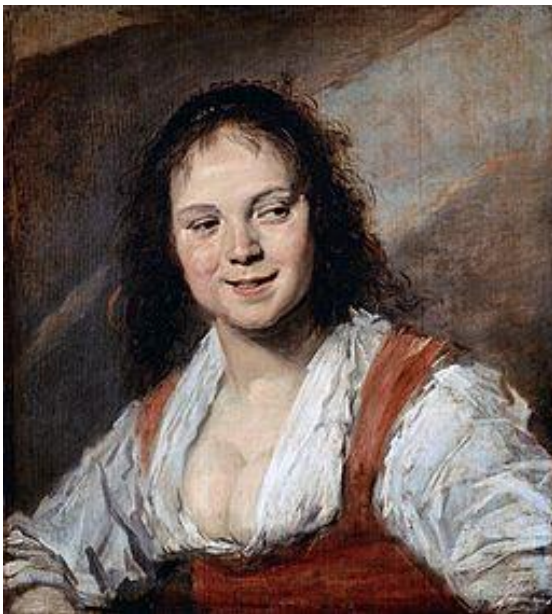
'Zigeunermeisje' van Frans Hals