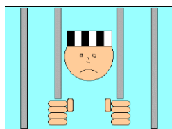
Ome Jan zit achter de tralies...